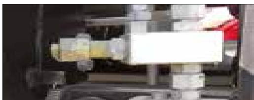
Capteur de fin de course haut et bas.